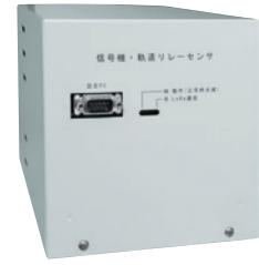
本体 W147×H147×D200mm (信号用リレーC形相当)