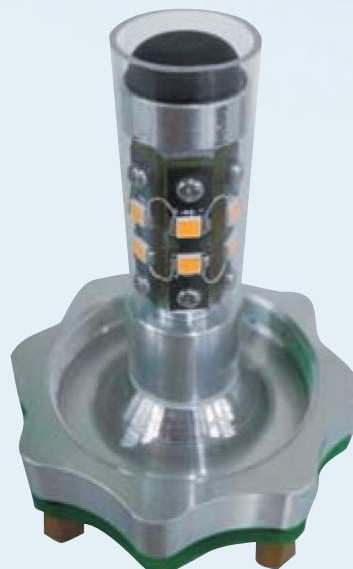
F形セミシールド用